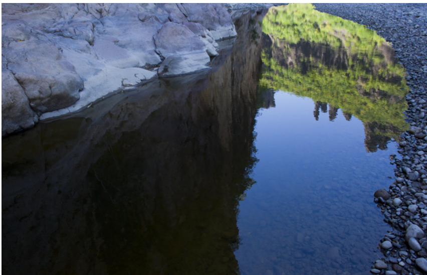
Recorrer el mar de la península de Yucatán permite ver la unión del Golfo de México con el Mar Caribe. Duisissequat vulputpat, veliqui smodipit at.

El tiempo remando para llegar hasta las dunas es de aproximadamente 40 minutos y créanme, vale la pena ya que ver un río unirse a unas dunas de arena que, a su vez se unen al mar, no es cosa de todos los días. Ya en las dunas, se puede practicar